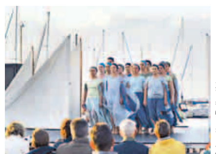
Eine Brandenburger Wanderbühne bringt Schauspielkunst in entlegene Gegenden