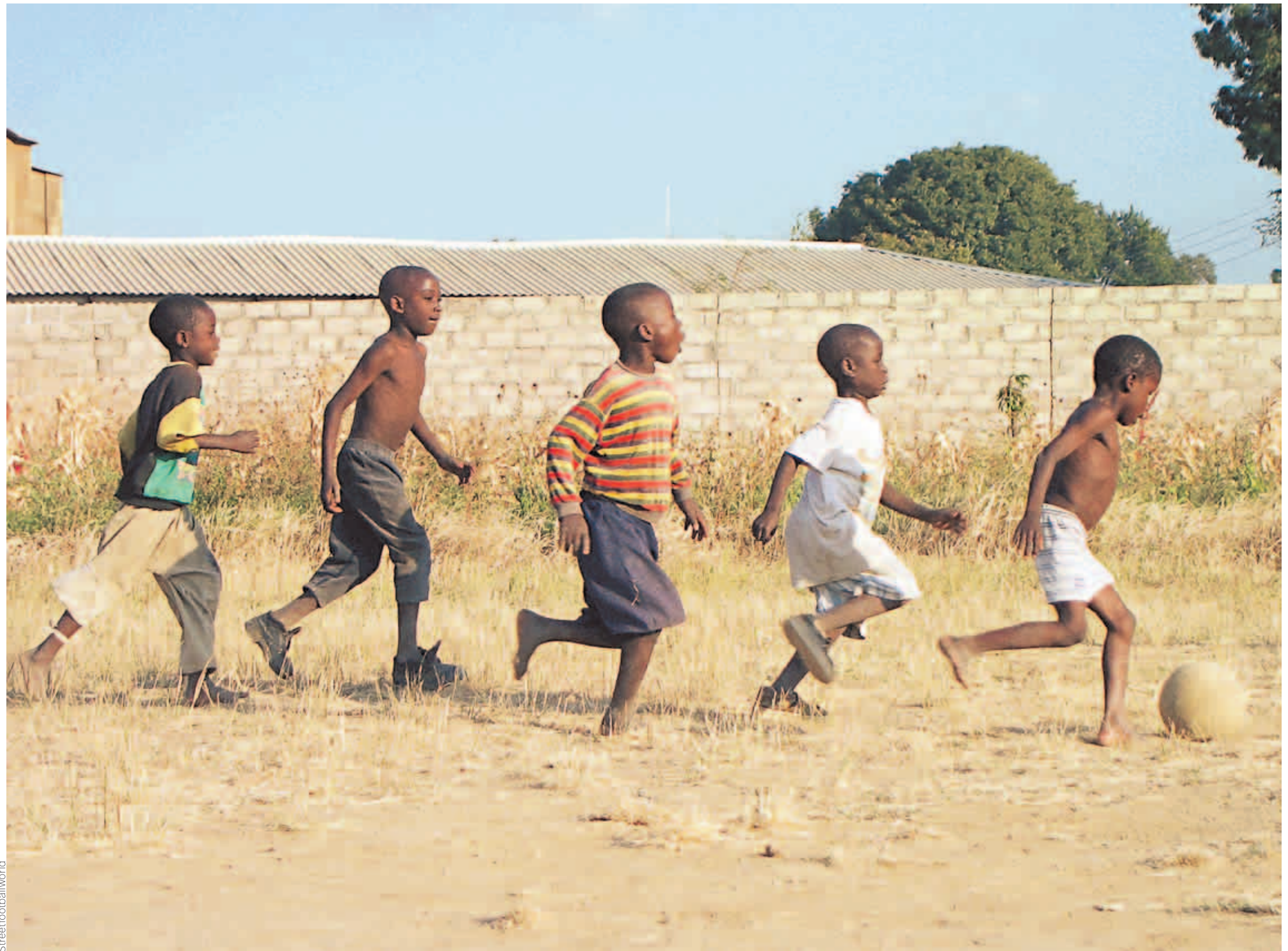
Fußball für Frieden und Toleranz – und gegen Armut, Gewalt und Rassismus