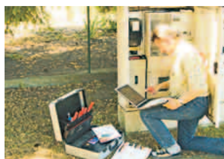
Ein Steuergerät für Lampen senkt den Energieverbrauch um bis zu 67 Prozent