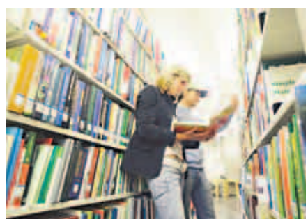
Der GREENPILOT leitet Wissensbegierige zu für sie relevanten Internetseiten weiter