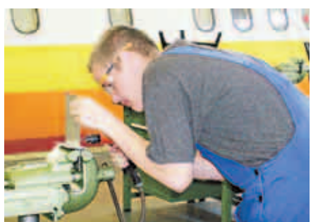
Ein Netzwerk verbindet Schülerfirmen in Brandenburg zum Wissensaustausch