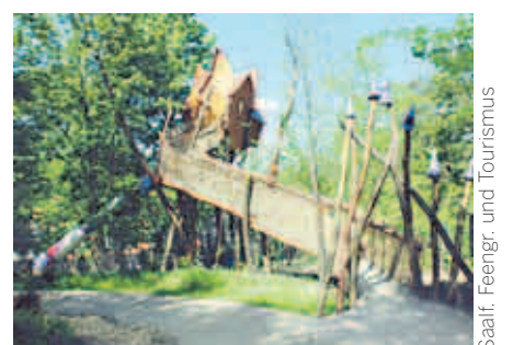
Zauberwesen verwandeln ein Bergwerk in eine Touristenattraktion